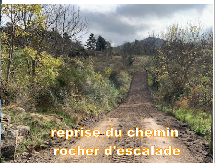
reprise du chemin rocher d'escalade