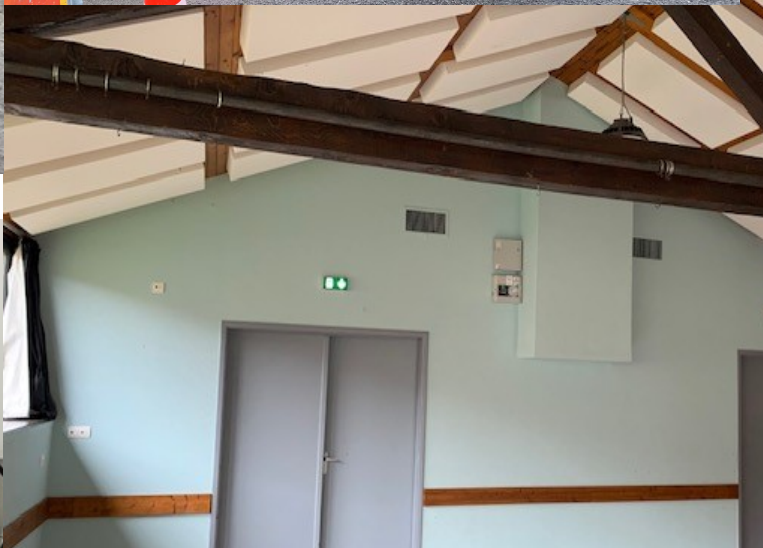
2 Octobre rénovation foyer rural phase 1