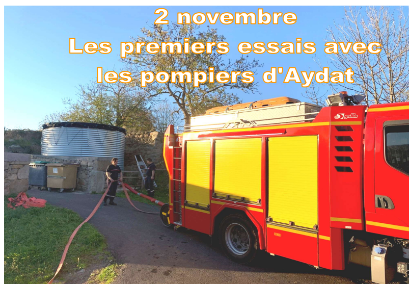
2 novembre Les premiers essais avec les pompiers d'Aydat