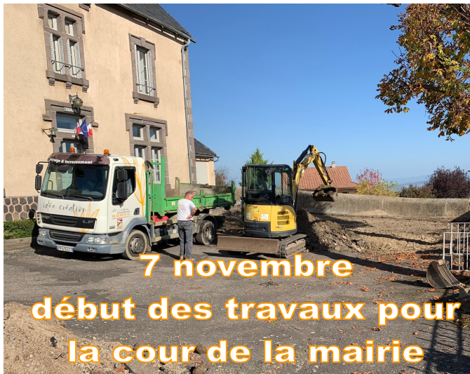
7 novembre début des travaux pour la cour de la mairie