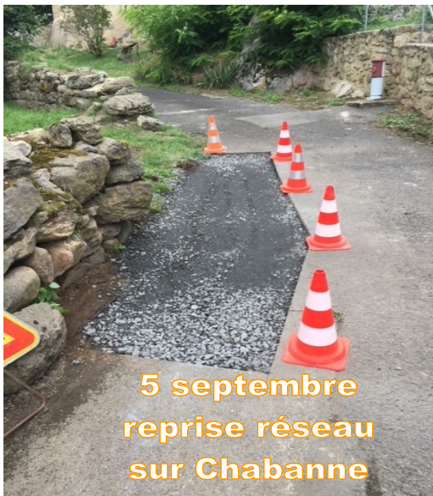
5 septembre reprise réseau sur Chabanne